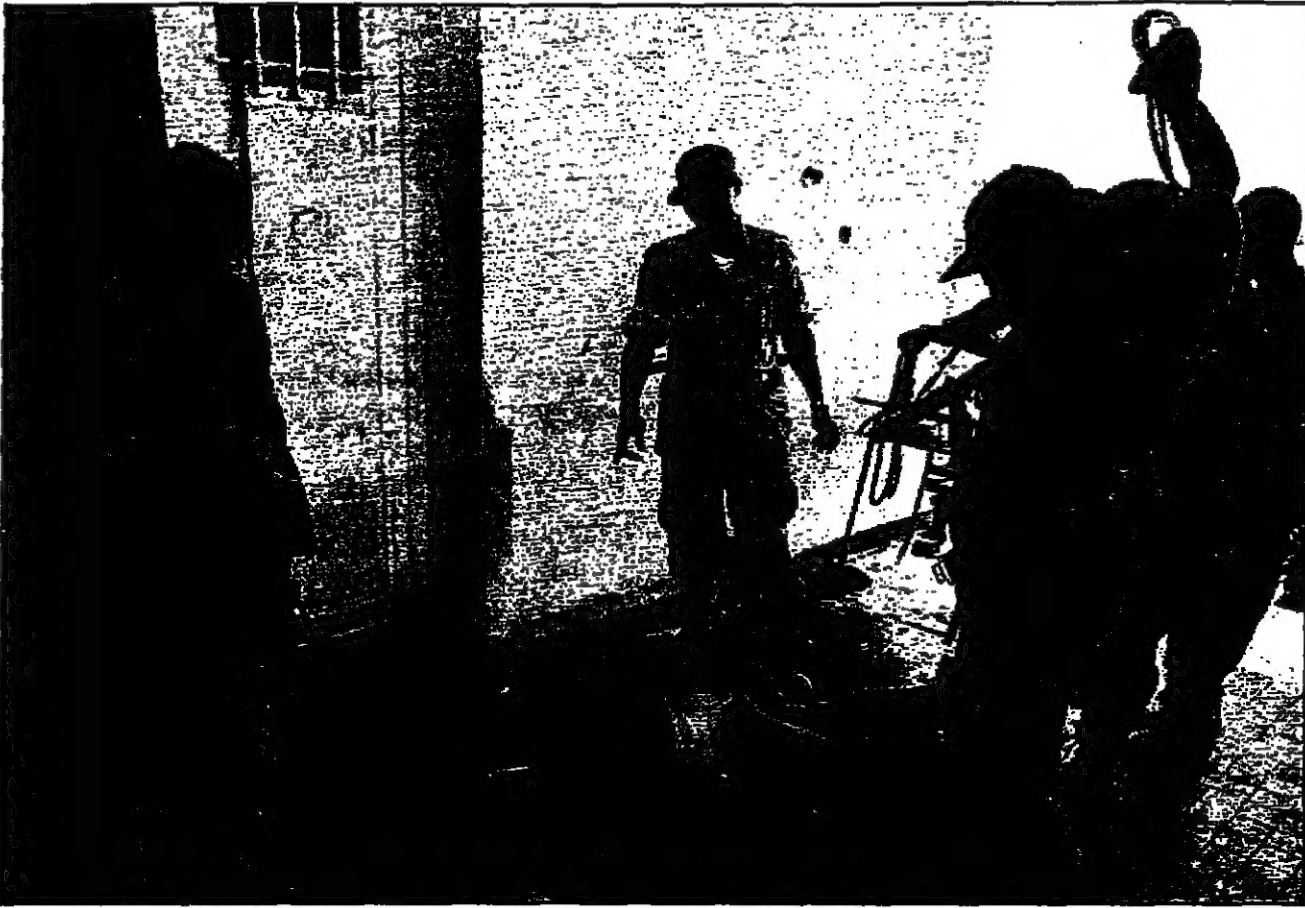
للمرشدون يتسرون جنديا سابقا في قوات موبوتو

باريس 16 أيار (مايو) - أكد مصدر فرنسي مطلع في باريس أن الرئيس الفرنسي جاك شيراك لم يطلب اللجوء إلى فرنسا، بل بقي في كينشاسا مع قواته. المصدر الفرنسي أكد أن موبوتو لم يتصل بالسلطات الفرنسية لطلب اللجوء، بل بقي في كينشاسا مع قواته. المصدر الفرنسي أكد أن موبوتو لم يتصل بالسلطات الفرنسية لطلب اللجوء، بل بقي في كينشاسا مع قواته.